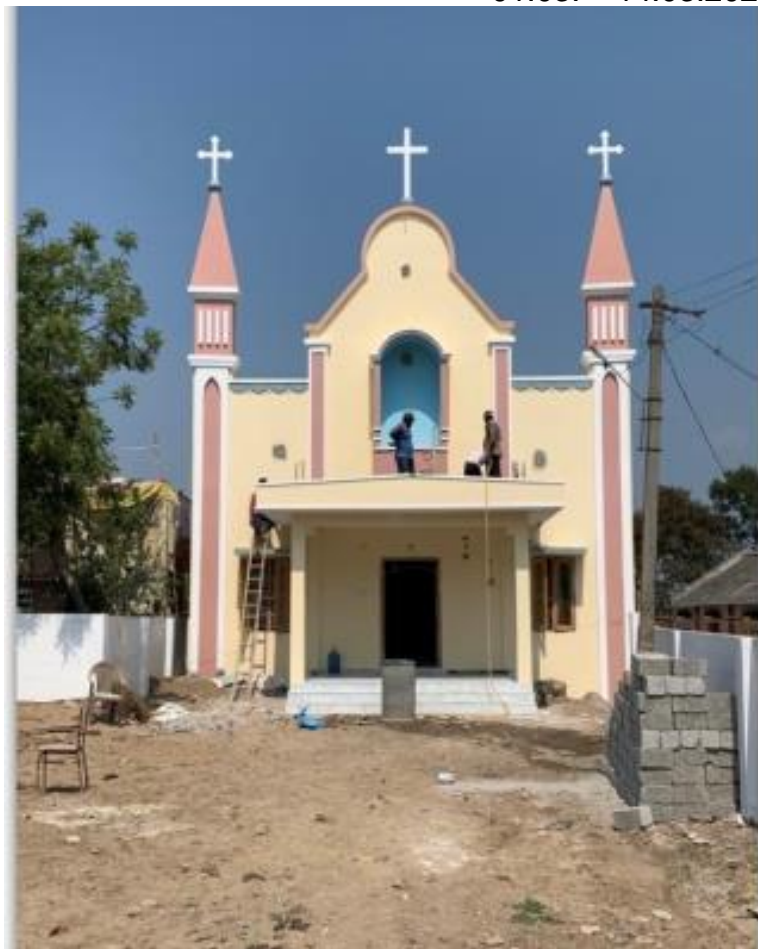
Neue Kirche in Buthumillipadu/Indien