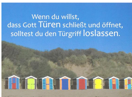
(Wort im Bild)

Perach: Dienstag 8.00 – 10.30 Uhr Reischach: Mo., Di., Do., Fr. 8.00 – 12.00 Uhr Mittwoch geschlossen