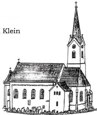
St. Peter u. Paul

Die gesamte Bevölkerung ist herzlich eingeladen!